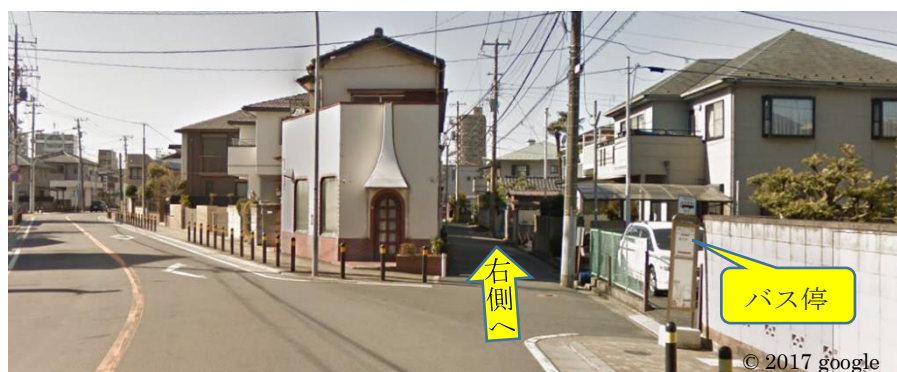
市川2丁目バス停付近