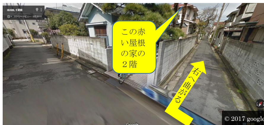
バス停のY字路を右に進んだあと、最後に右に曲がる場所