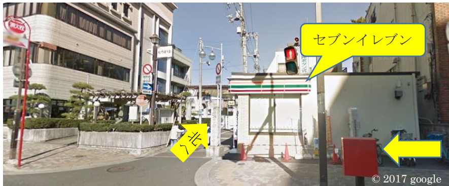
国道14号線の歩道、大門通りの入り口