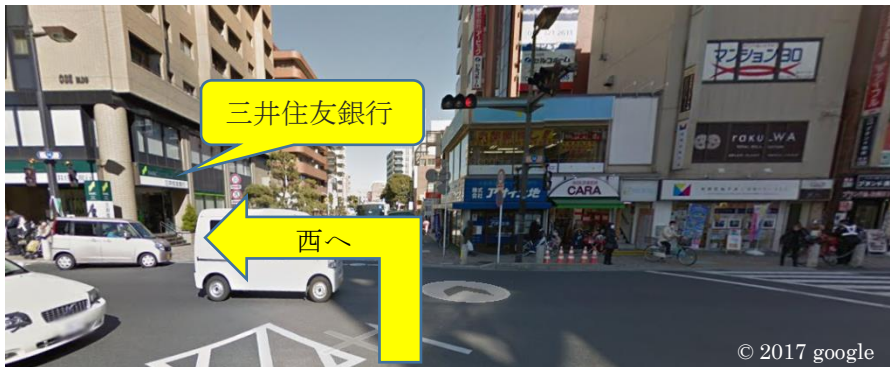
国道14号線 市川駅前の交差点