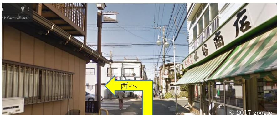
大門通りとバス通り(市川真間通り)の交差点(信号あり)